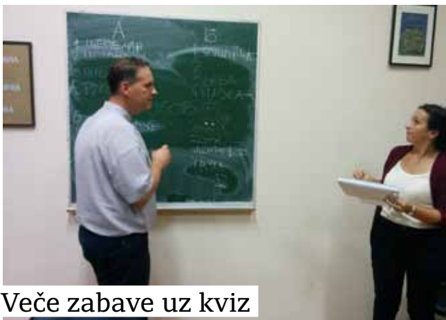
Veče zabave uz kviz